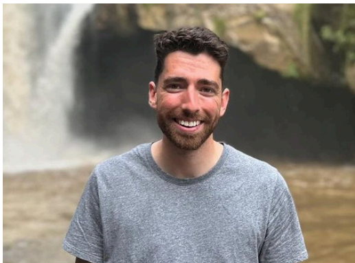
Javier Medina @javiermedinaf