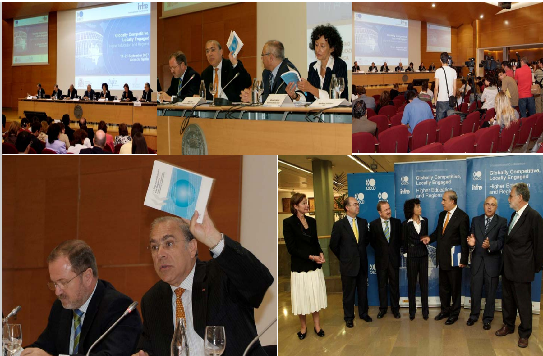
CONFERENCIA INTERNACIONAL OCDE-UPV VALENCIA. SEPTIEMBRE 2007