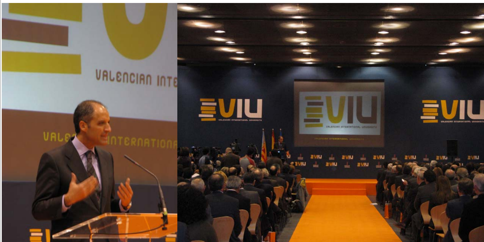
COORDINACIÓN GENERAL. PRESENTACIÓN UNIVERSIDAD VIU. ENERO 2008